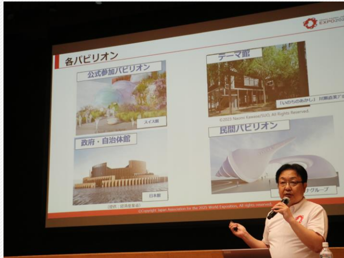
公益社団法人2025年日本国際博覧会協会 審議役 川村 泰正 氏